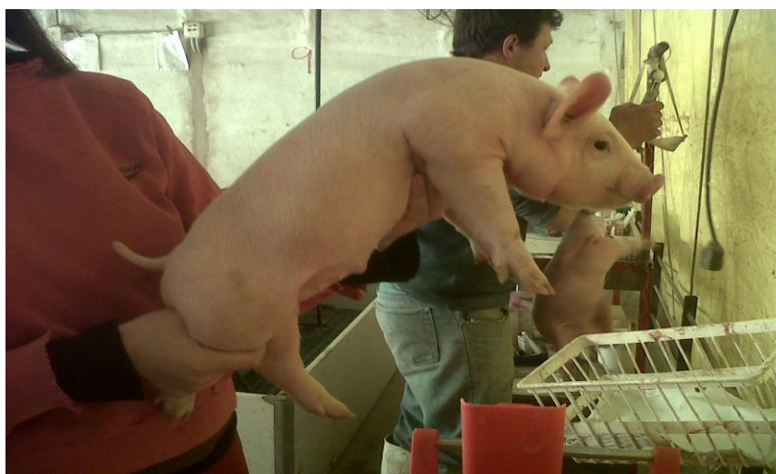
Lechones tratados únicamente con Hierro Dextrano