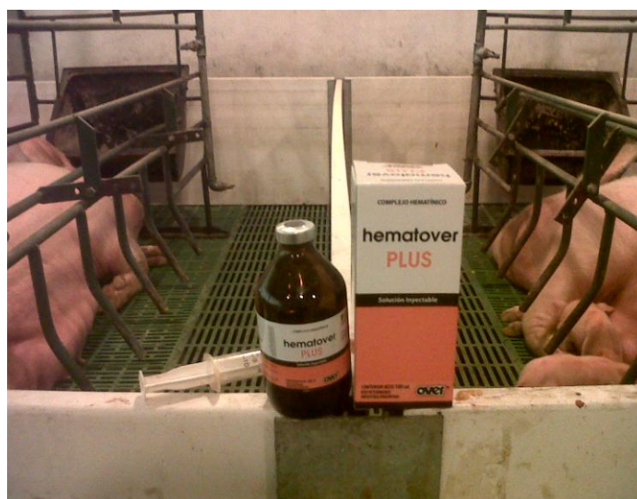
Frasco de Hematover Plus