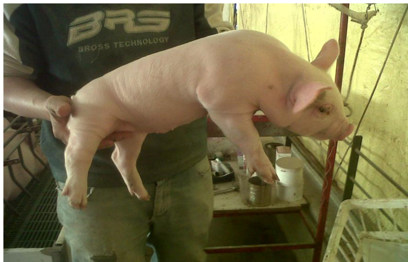
Lechones tratados con Hematover Plus + Hierro Dextrano