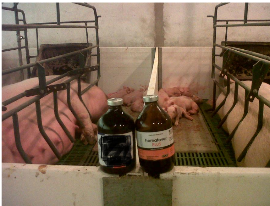
Frascos de Hematover Plus y Hierro Dextrano Comercial